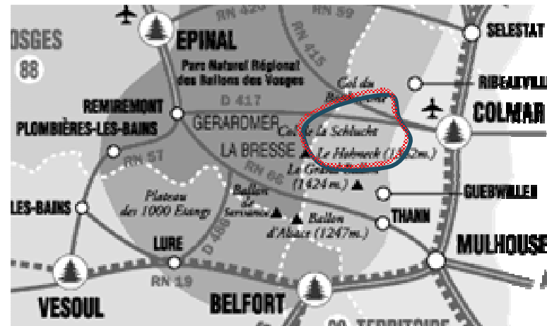
Position du Pays Thur Doller, entre Alsace et Vosges